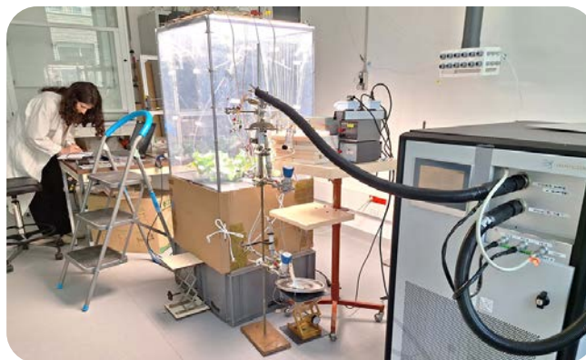
Illustration d'une expérimentation de mesure des COV émis par les compartiments aériens et souterrains de trois plantes de colza (A. Voyard, 2024)

Les résultats de cette étude montrent que les émissions de COV par les plantes suivent un rythme diurne et sont dominées par le méthanol, puis le méthanthiol dans le cas du colza ou les monoterpènes dans le cas de la tomate. Des composés spécifiques à chaque plante sont également émis. Les émissions nettes de COV par les racines détectées à la surface du sol représentent moins de 5% des émissions totales de la plante en conditions normales. Cependant, une fois le sol autour des racines retiré, les flux de COV issus des racines augmentent fortement et contribuent autant voire plus que les parties aériennes aux émissions totales de COV par la plante, principalement via l'émission de méthanol. Ceci suggère un impact potentiellement non négligeable des racines sur la qualité de l'air lorsqu'elles sont exposées à l'air.