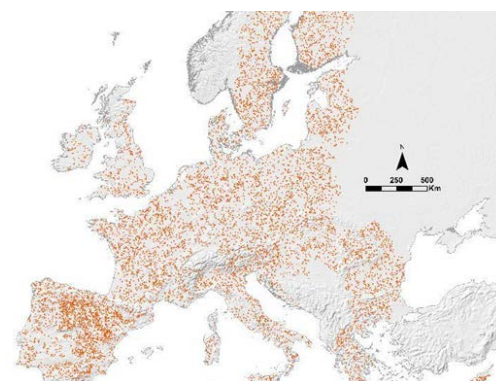
Carte LUCAS SOIL

En Europe, une étude récente estime que 60% des sols sont dégradés par les activités humaines. Or les sols sont essentiels au bon fonctionnement des écosystèmes et leur préservation est indispensable pour maintenir des conditions de vie durables. Pour élaborer au mieux les politiques publiques permettant d'avoir des sols sains « healthy soils » à l'horizon 2050, il faut ainsi définir des indicateurs de santé des sols associés à des valeurs cibles qui soient scientifiquement étayés. Cela ne peut se faire qu'en se basant sur des réseaux de surveillance des sols permettant de couvrir toute la diversité des sols européens. Or aujourd'hui, il existe dans de nombreux pays, deux réseaux parallèles que sont les réseaux nationaux (N-SIMS) et le réseau européen LUCAS Soil.