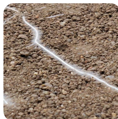
Poils racinaires observés le long de racines de blé en rhizotron

Pour mieux hiérarchiser les facteurs influençant l'évolution spatiale et temporelle des flux de rhizodéposition, nous avons développé un nouveau modèle, RhizoDep , qui simule la croissance des racines en 3D, leur respiration et leur rhizodéposition en fonction d'un bilan en carbone réalisé en tout point du système racinaire.